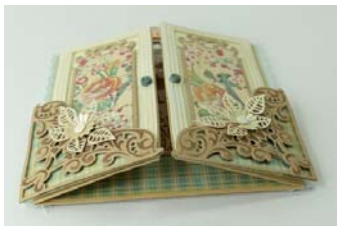
Foto 2: Snijd een strook karamel van 21 x 26 cm. Vouw vanaf links: 6,5 cm dalvouw, 13 cm dalvouw. Er blijft 6,5 cm over. Ril de hele breedte op 7 cm vanaf onderen. Maak 2x een snede van 1 cm onderaan op beide vouwen. Snijd 1 cm in het midden onderaan volgens voorbeeld recht af. Vouw aan weerskanten de punt diagonaal naar boven toe. Plak de twee deurpanelen vast op flappen aan de voorkant van de kaart. Laat het drogen.

Foto 3: Vouw de onderste 7 cm naar achteren en zet het middelste gedeelte aan de zijkanten vast. Midden openlaten, zodat je er iets in kunt stoppen. Achterkant kaart: Plak aan weerskanten kant en versier de flap met dessinpapier.