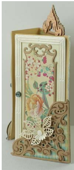
Foto 1: Stans en embos de rechthoek 2x uit lichtgeel en 2x uit champagne. Snijd het midden (met de hand) uit champagne en bewerk de rand met Inka Gold-Alt Silber. Zet de rand met 3D-kit vast op lichtgeel. Stans de opvolgende rand één keer uit bloemendessin en één keer uit kraftkarton. Zet het volgens voorbeeld in het midden vast op lichtgeel. Plak de knoopjes op. Laat het drogen. Stans LRO319 2x uit kraftkarton en 1x uit mango. Bewerk mango met Inka Gold Aprikot. Plak mango met 3D-kit op kraft vast. Laat het drogen.